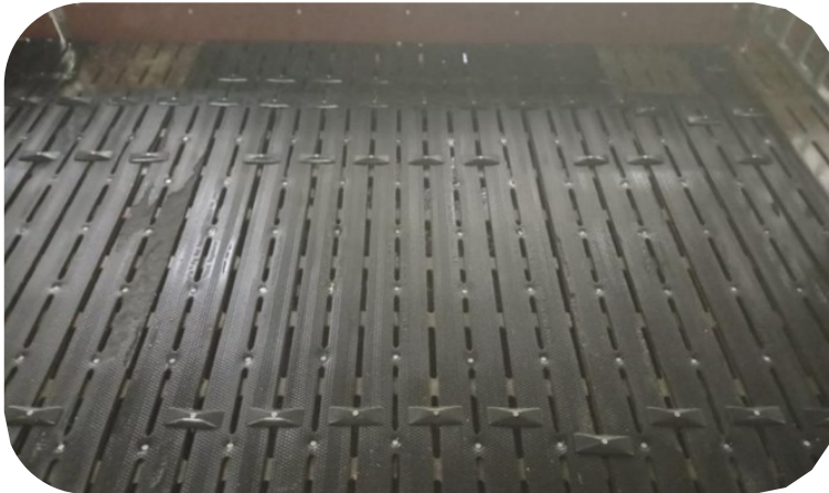
Exemple de revêtement antidérapant pour une case infirmerie pour truie