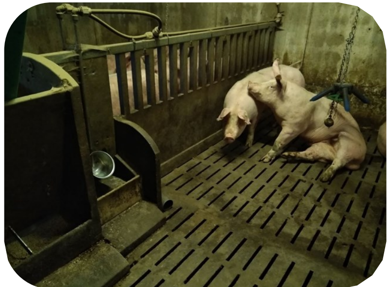
Exemple de case infirmerie pour charcutier